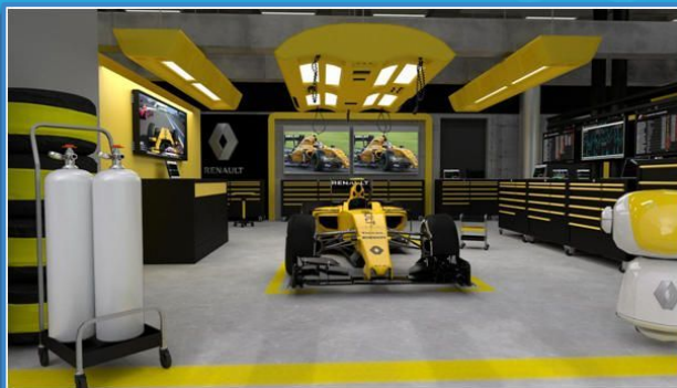
Box F1 Renault - Experiência VR