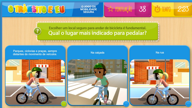
O Trânsito e eu - Quiz AR e Jogo Mobile