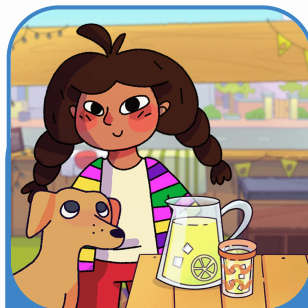
Turma das Patinhas