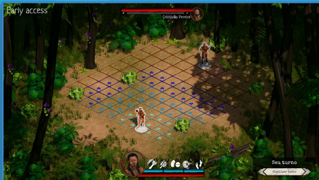
Jaguareté - Jogo de Turnos