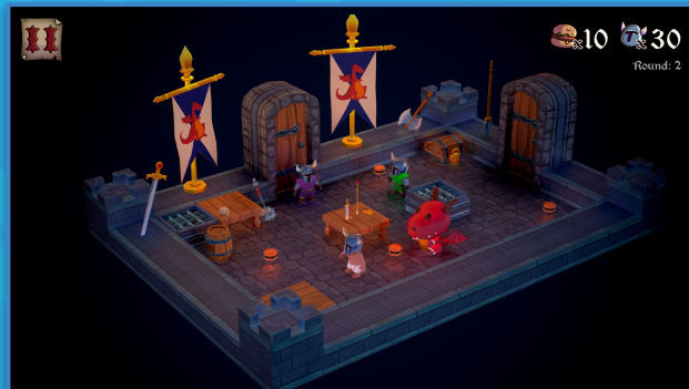
TavernAR - Jogo AR