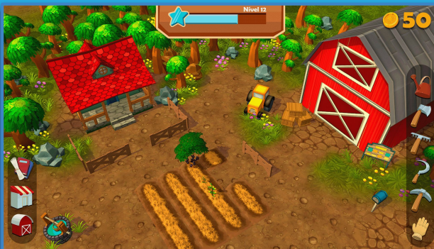
EcoSítio - Jogo de Fazenda