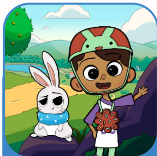
As Aventuras do Capitão Algodão